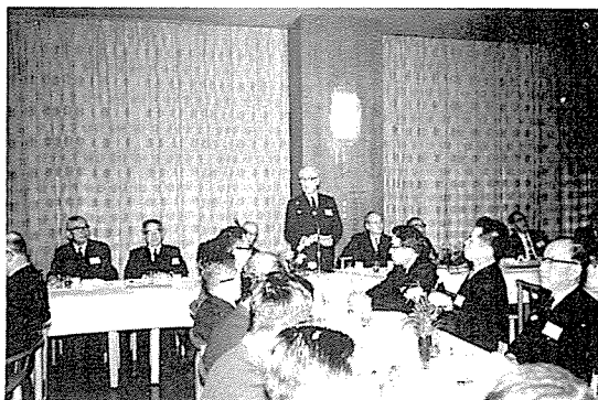
午饗会で講演する宇佐美日本銀行総裁