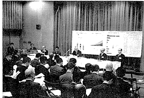
第5セッションパネル討論会会場