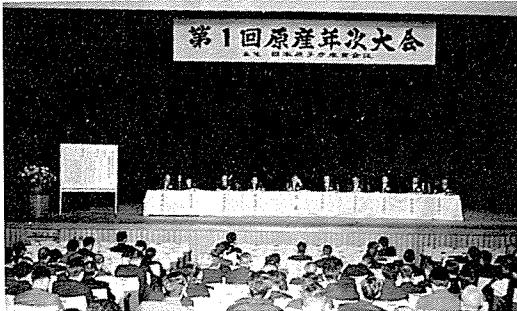
第3セッションシンポジウム会場