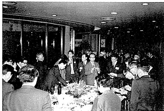
参加者全員によるレセプション