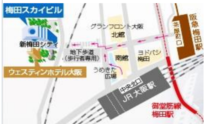
(大阪会場アクセス地図)