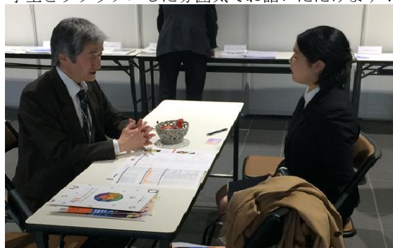
中ブース、小ブース設置例 (左:中ブース、右:小ブース)