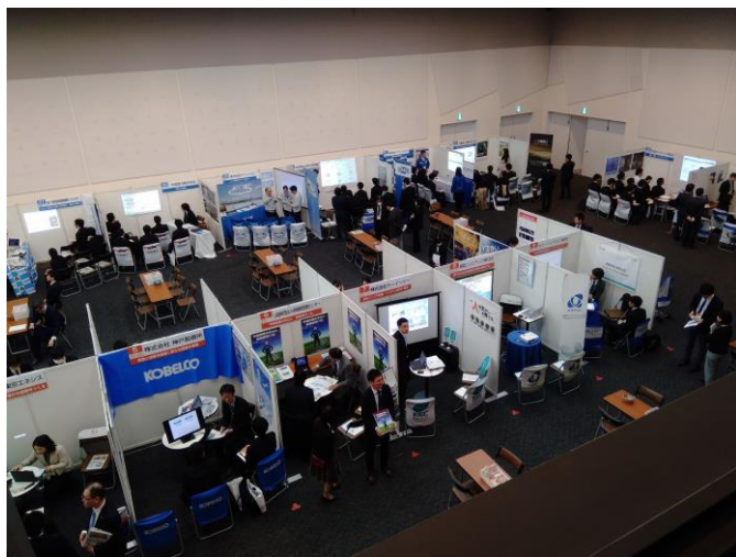
←大阪会場の模様 (過去のセミナーの様様)