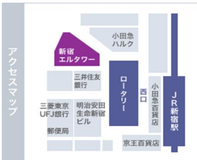
(東京会場アクセス地図)

(大阪市北区大淀中1-1 梅田スカイビル タワーウエスト10階、JR大阪駅より徒歩7分)