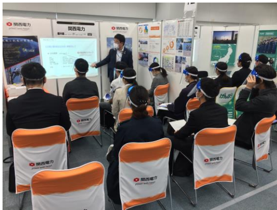
コミュニケーションエリア