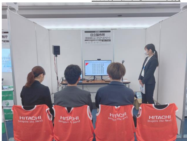
Web方式によるブース出展