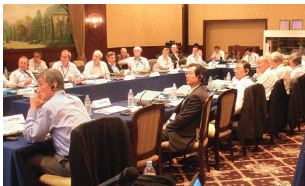
07年6月、京都での日仏原子力専門家会合（N-20）

フランスとは、原子力政策や技術開発等について日仏原子力専門家会合（N-20）を毎年開催し、またドイツとは日独電力・原子力専門家会合を電気事業連合会と協力して開催し、原子力発電利用や課題について情報・意見交換を行っています。ロシアやカザフスタン等とも、協力促進のための交流を適宜実施しています。