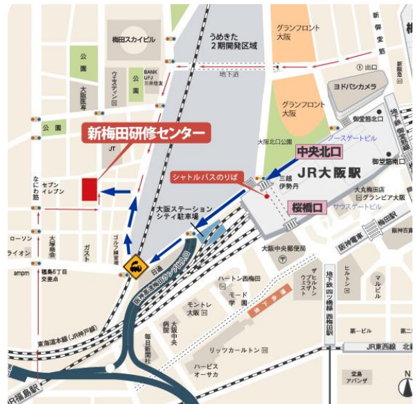
(大阪会場アクセス地図)