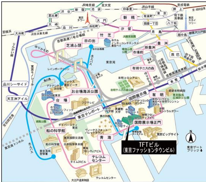
(東京会場アクセス地図)