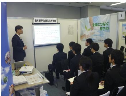
中ブース設営例 (前回セミナー)