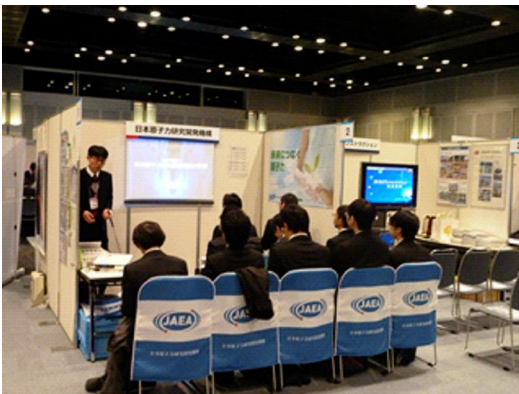
中ブース設営例 (前回セミナー)