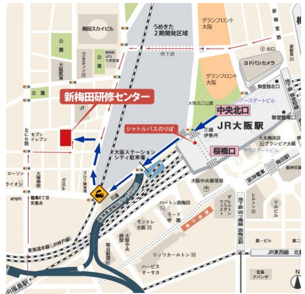
(大阪会場アクセス地図)